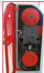
stabiler Riemenantrieb solid and smooth belt run