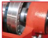
24-Schritt Teilung 24 divisions