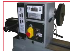
LCD Geschwindigkeitsanzeige serienmäßig LCD speed indication included in delivery