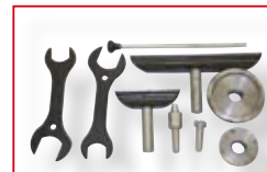
Zubehör im Lieferumfang accessories included in delivery