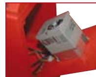
Hochleistungs Frequenzumformer high-performance frequency convertor