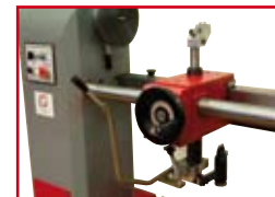
Kopiervorrichtung bei DBK Modellen copy device at DBK models