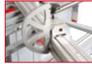
Aluminiumanschlag mit Klappanschlag stable fence with work piece end stop