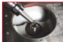
austauschbarer Fräsdorn MK4 exchangeable spindle arbor MT4