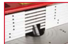
Integralanschlag integrated fence