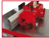
präzise, einstellbare Fräshaube mit Querführung precisely adjustable hood with crossway guide